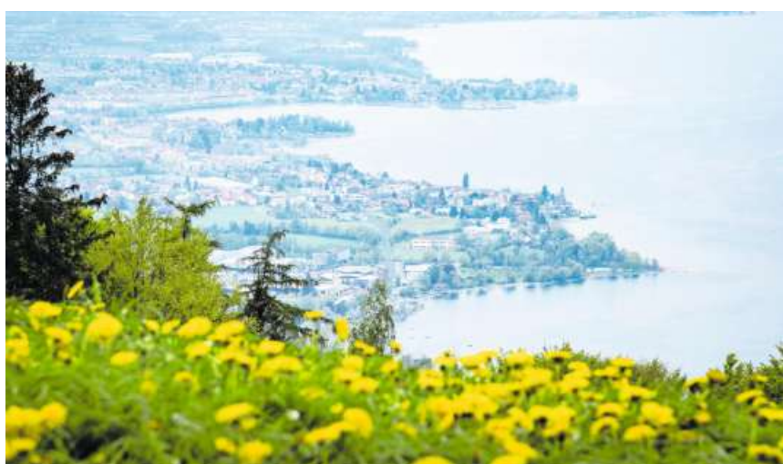
Vom höchsten Punkt hat man eine schöne Aussicht auf den Bodensee.