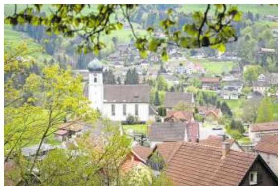
Blick auf Grub SG beim Aufstieg zum Fünfländerblick.

Tief- und Weitblicke sind garantiert: Diese kurze Tour rund um Grub SG führt über eine Hängebrücke und zu einem Aussichtspunkt.