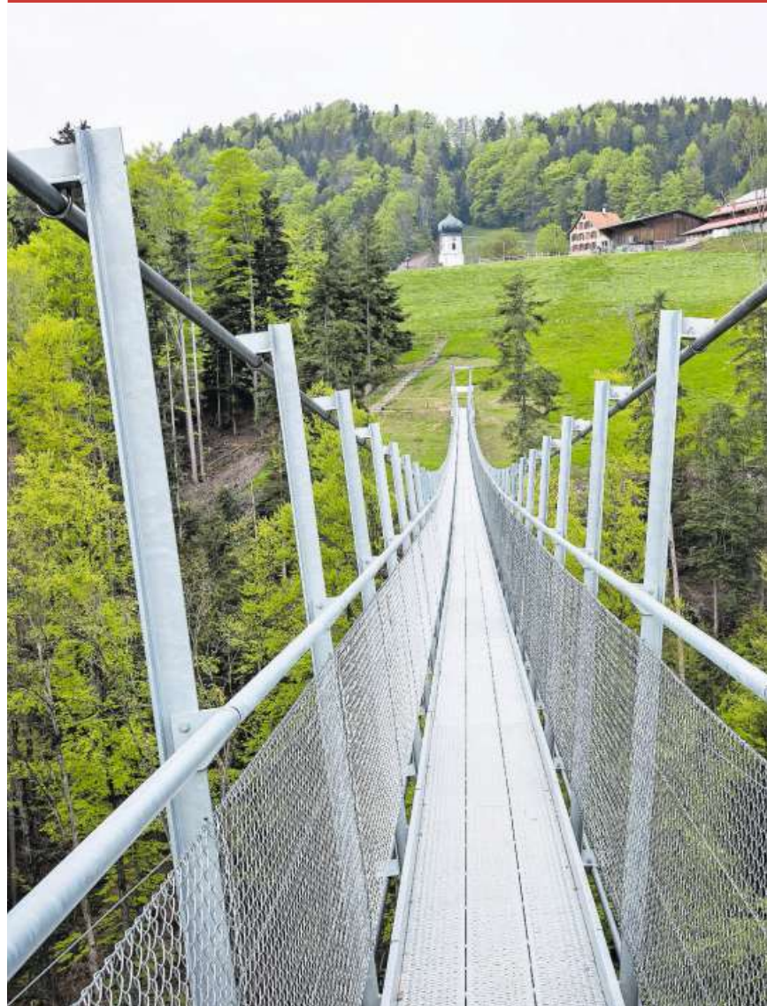
Die Hängebrücke verbindet Grub AR mit Grub SG.