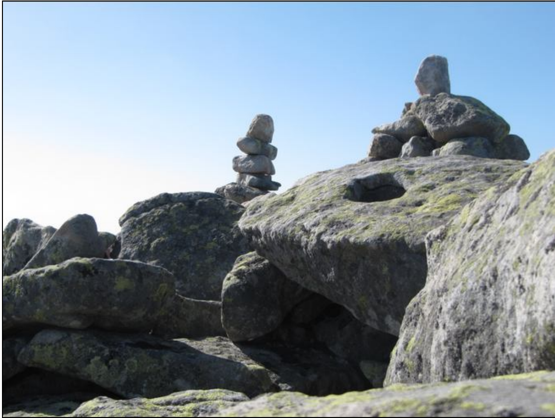
Zwei der vielen Steinmannli