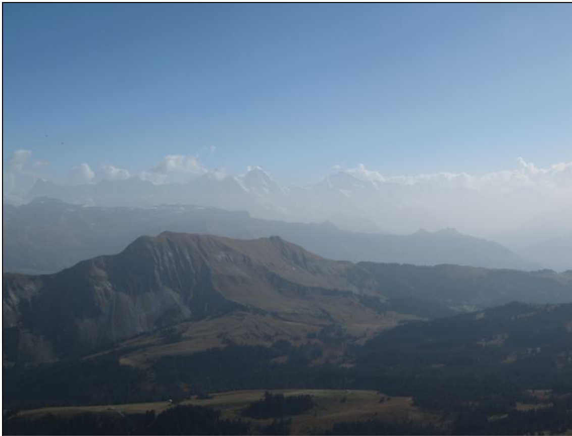
Ein besseres Foto lag nicht drin...