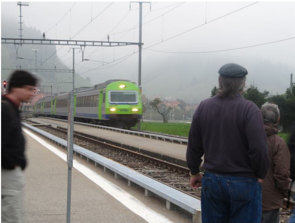
Noch gut 2 ½ Stunden und ich bin zu Hause