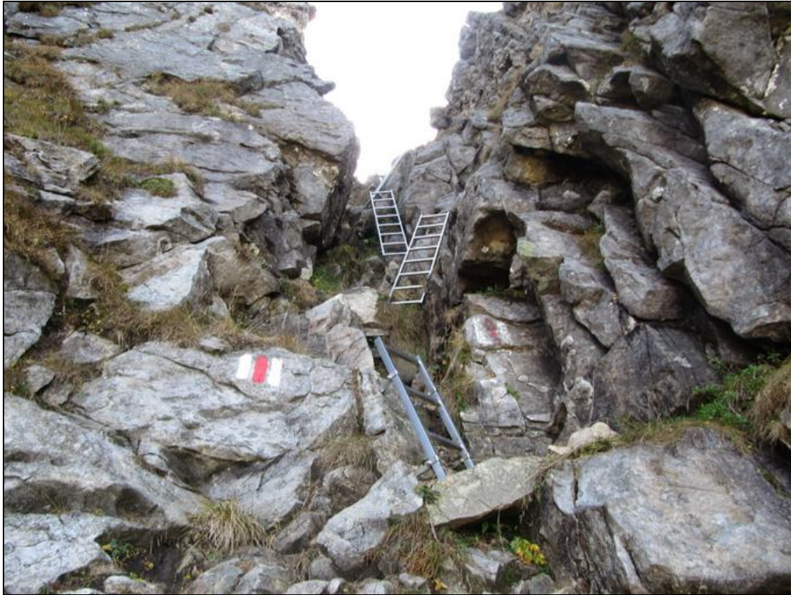
Die Leiterli helfen hinauf