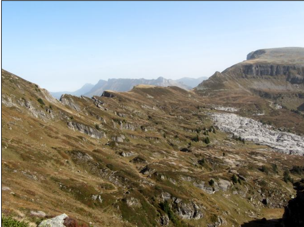
Wysschrüzgrat Ganz rechts: Hohgant und Furggengütsch Hintergrund Mitte: Schrattenfluh