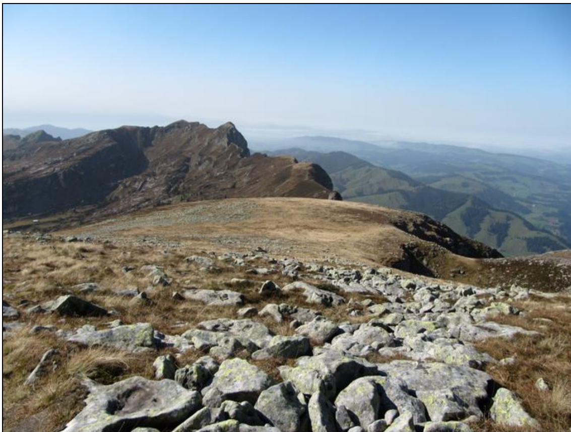
Blick zurück auf den bisherigen Weg