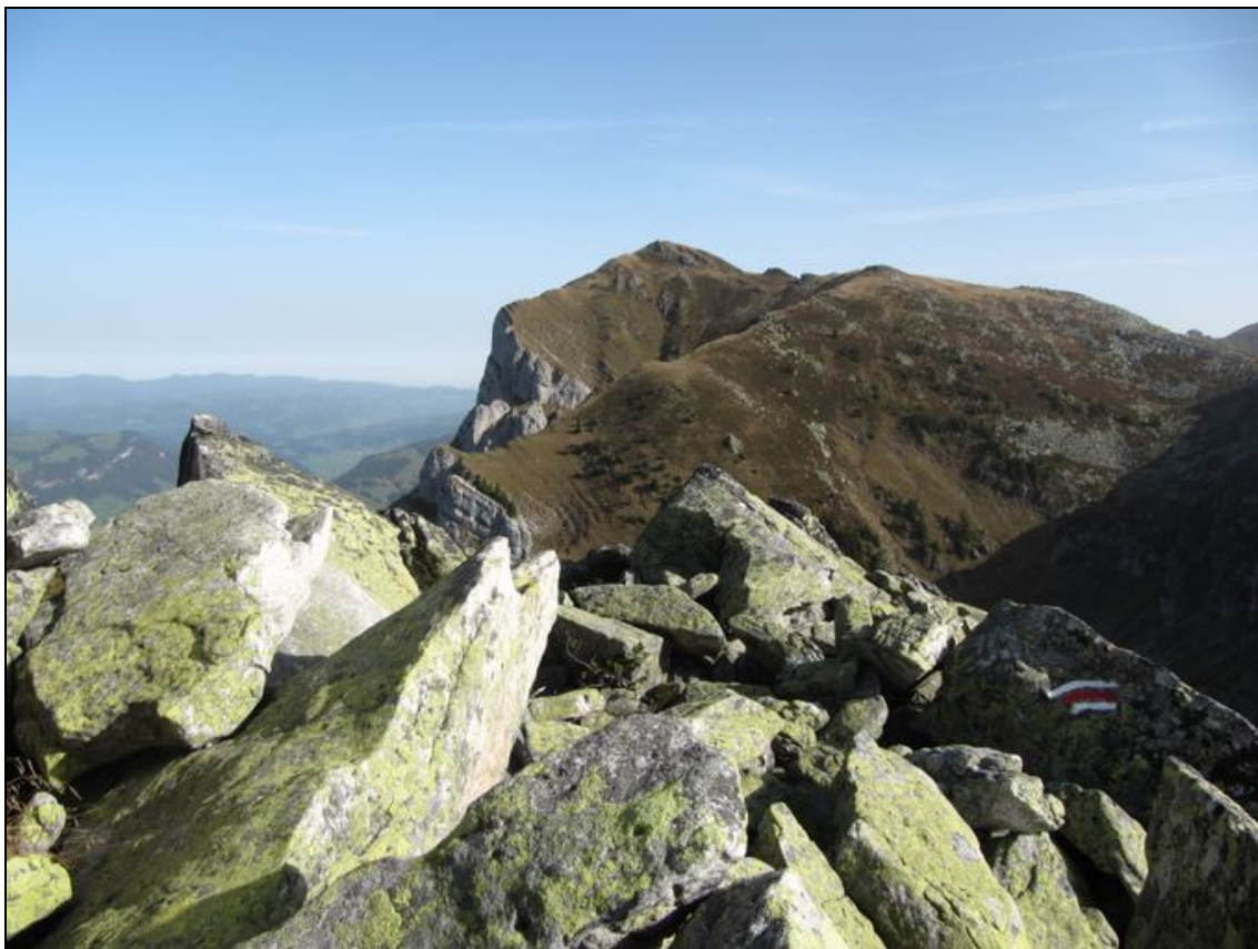
Blick hinüber zum Hohgant West