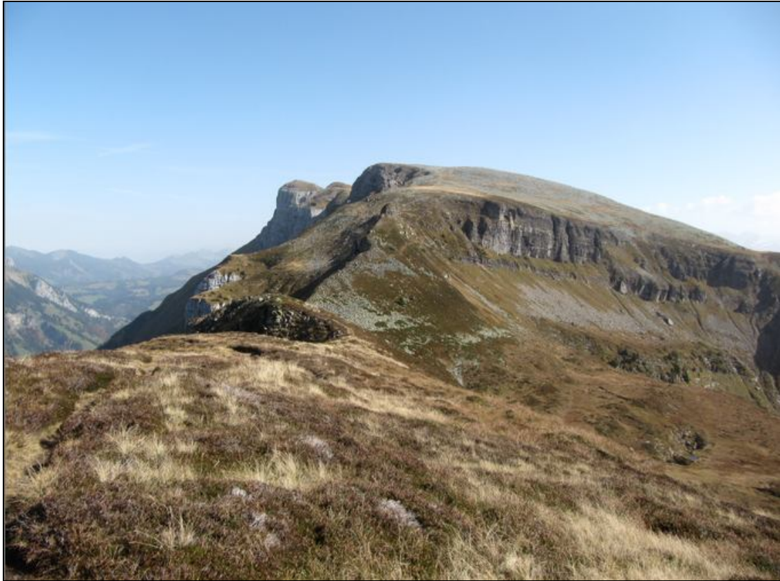
Hohgant / Furggengütsch / Steinige Matte