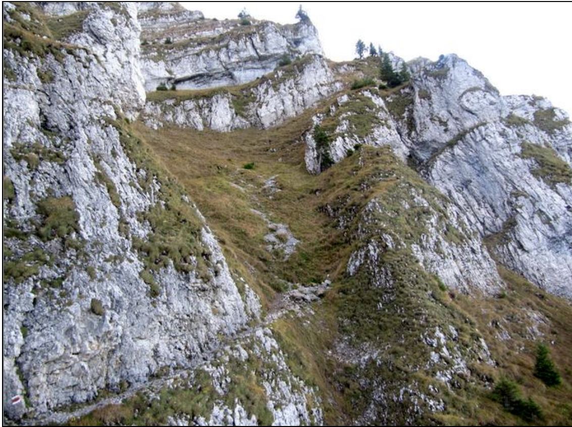
Aufstieg zum Trogenhorn