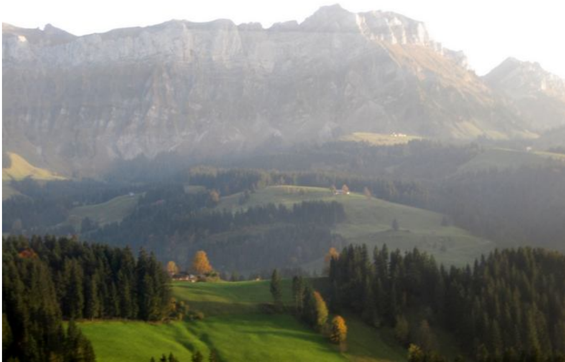
Da oben war ich!