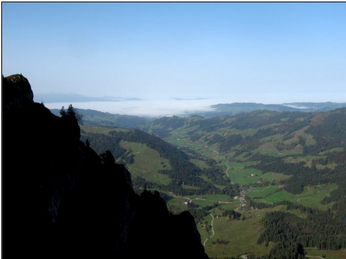
Zulgtal und Thunersee (unter dem Nebel)