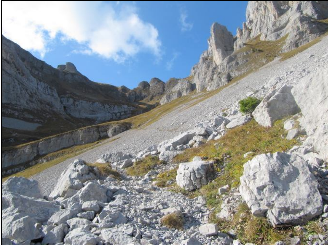
Der erste, sehr steile Teil des Abstiegs (ab dem Furggengütsch) ist gemeistert