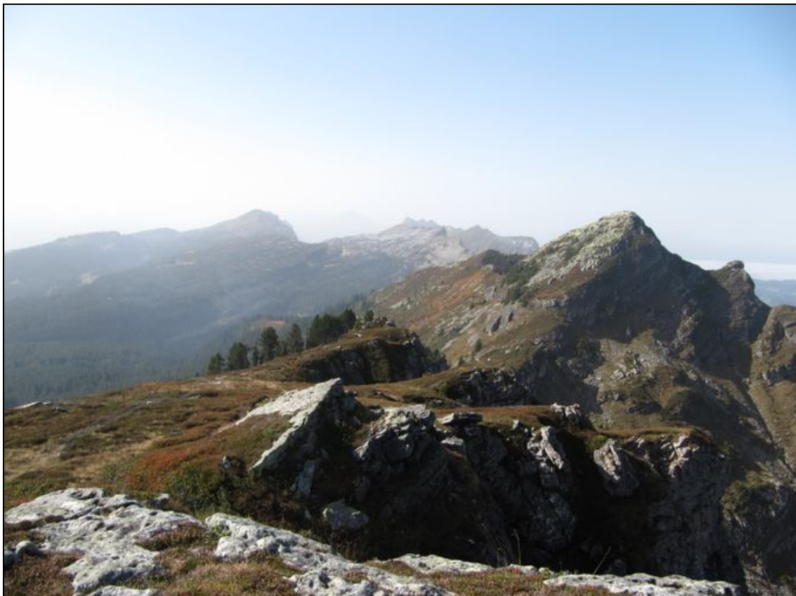
Rechts: das Trogenhorn