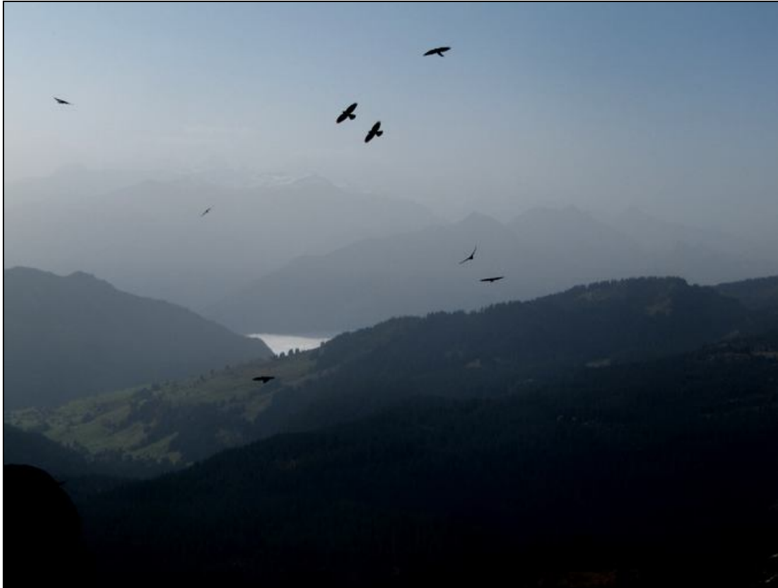
Aussicht vom Trogenhorn nach Süden