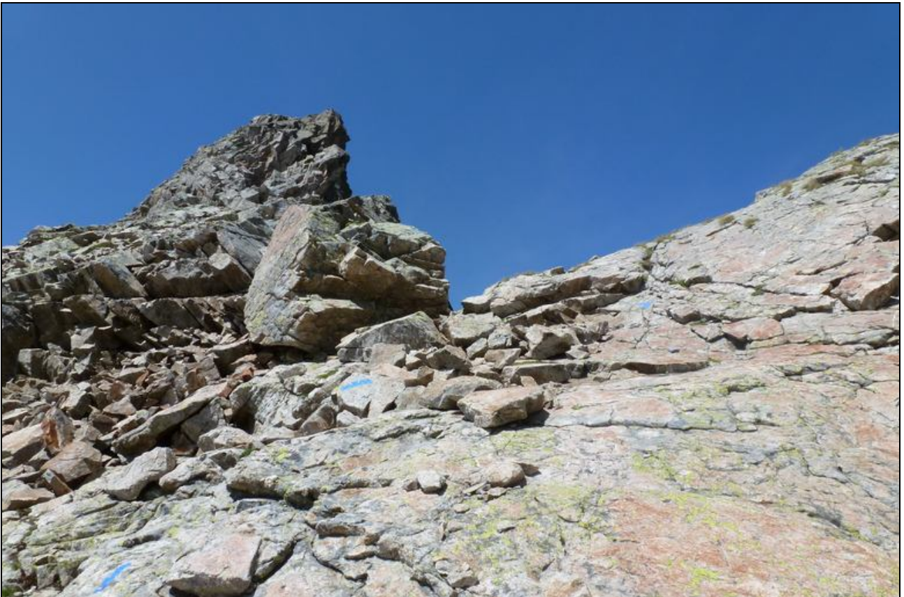
Bald ist der Himmel erreicht