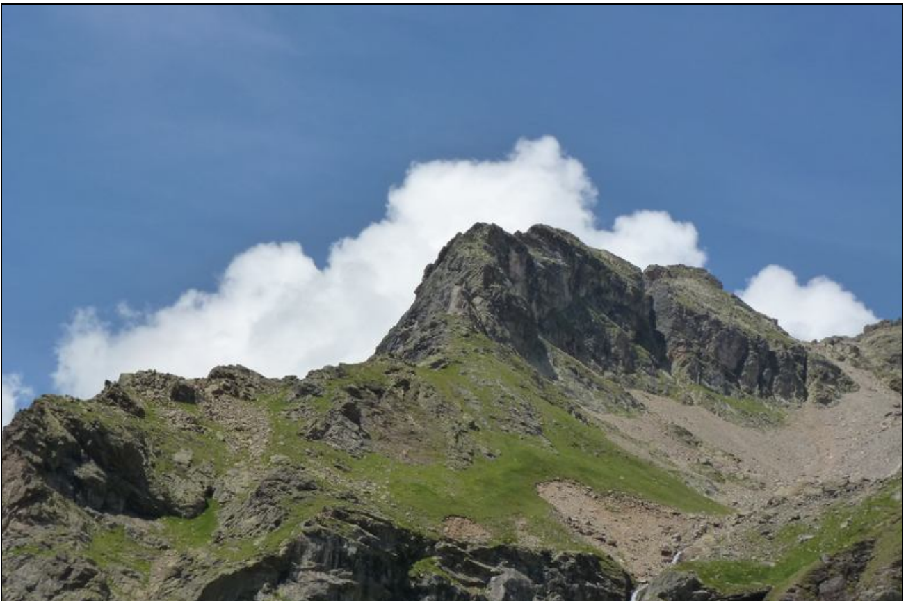
Da oben war ich!