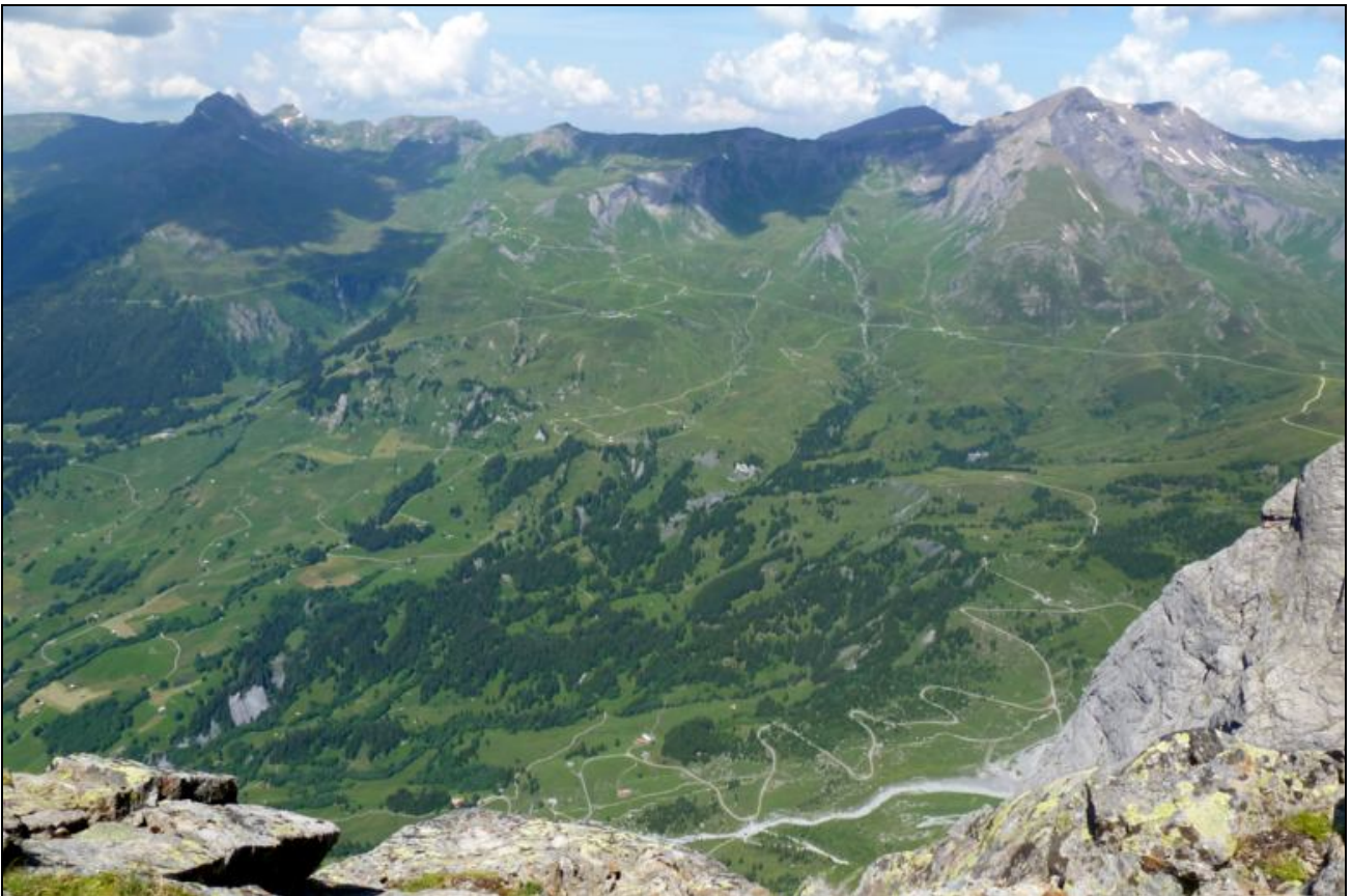
und Grindelwald First als Vis-à-Vis