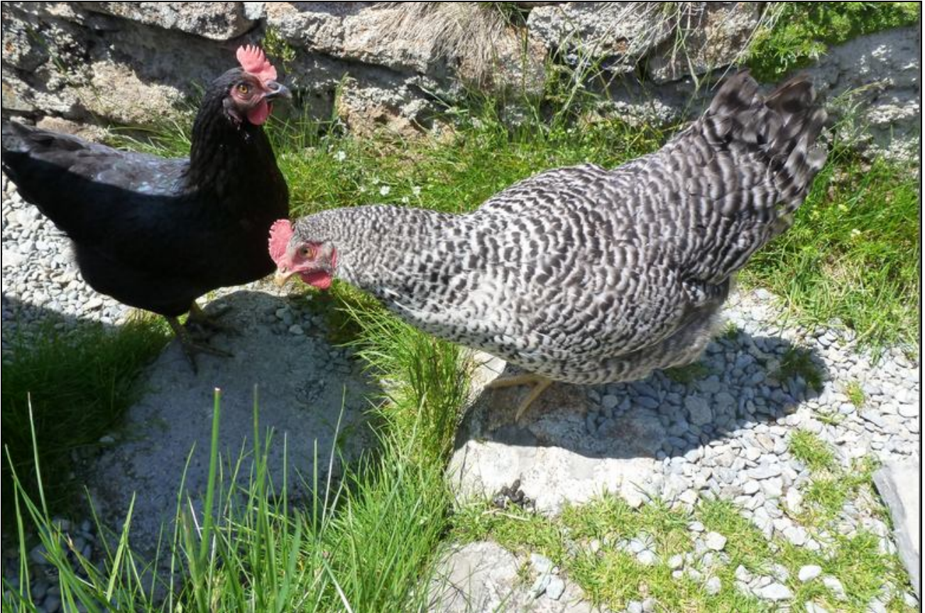
Ein Foto als Zeichen der Dankbarkeit an die hütteneigenen Lieferantinnen der Spiegeleier