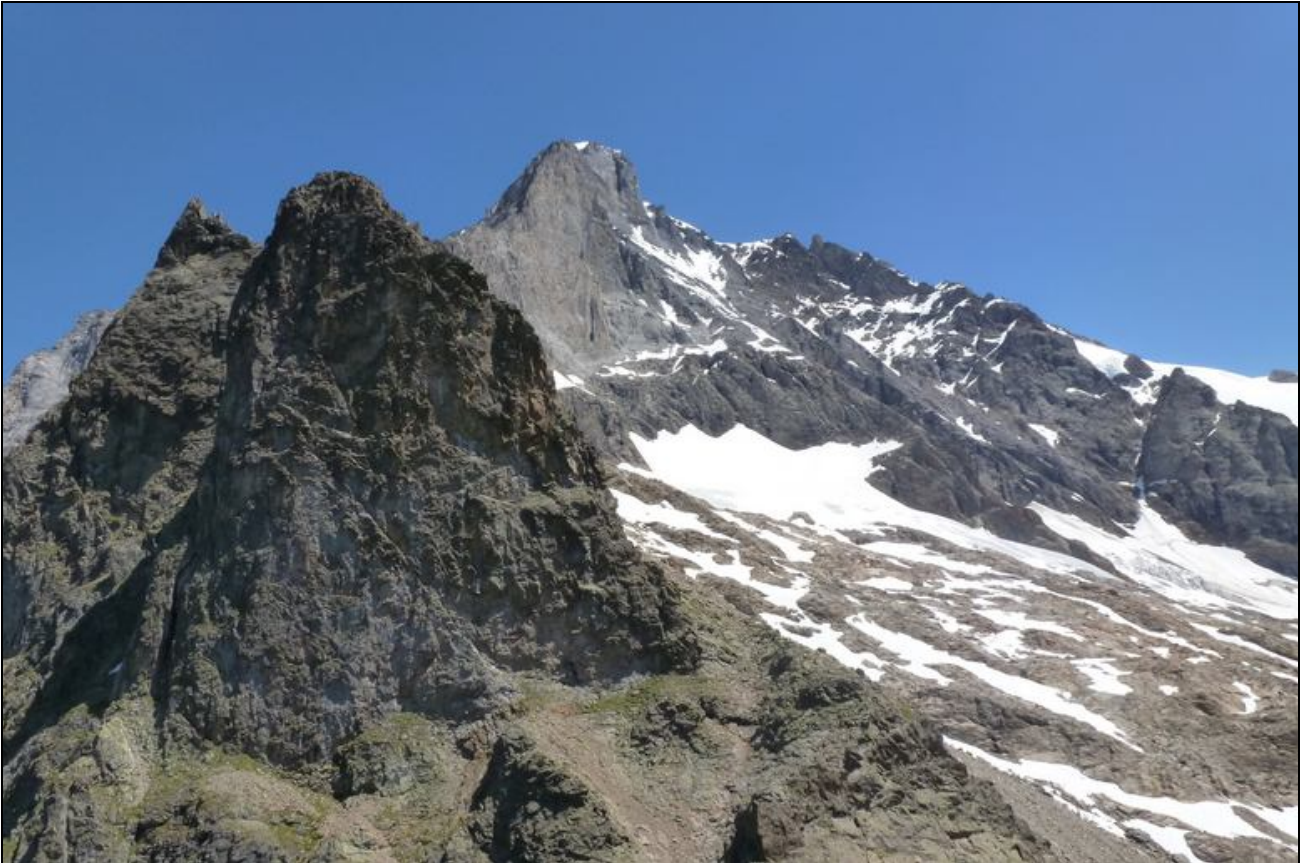
Die Wetterhörner als Nachbarn