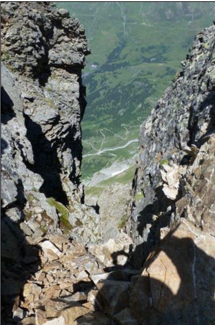
Tiefblick auf die Strasse zur Gr. Scheidegg durch eine der beiden Scharten, die man passieren muss