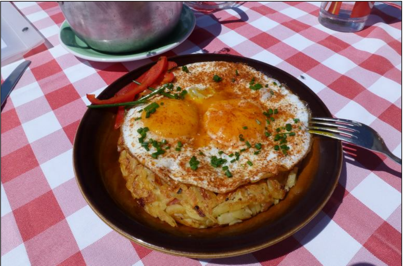
Mein wohlverdientes Mittagessen