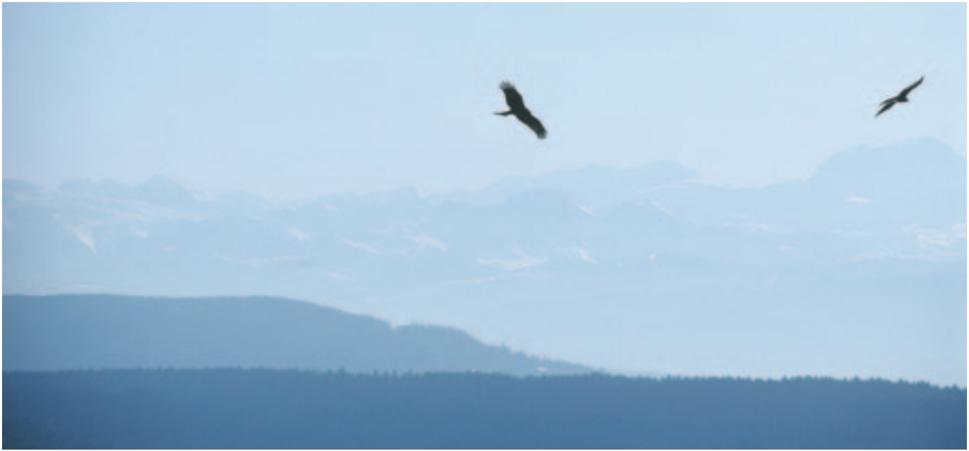
Über dem Mittelland: zwei Rotmilane im Segelflug. Wie andere Greifvögel werden sie erst gegen Mittag aktiv, wenn die Thermik einsetzt und ihnen kräftesparendes Segeln erlaubt. Greifvogelbeobachtung ist deshalb auch etwas für Langschläfer...