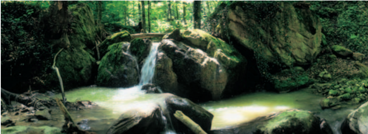
Vom Gletscher links liegen gelassen: Findlinge im Fällandertobel

Das Tobel wiederum dürfte sich wie folgt gebildet haben: Nach dem Rückzug des Gletschers bildeten sich hinter den Moränenwällen Wasserrinnen. Aus diesen entstanden die Tobelbäche, welche zuerst den Gletscherschutt wegschwemmten und danach durch Unterspülung der Hänge das Tobel ständig verbreiterten.