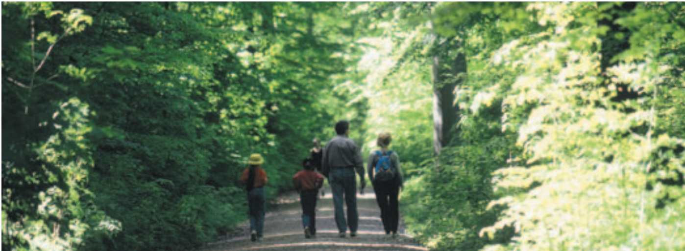
Wanderrätsel: Unterwegs ins Degenried oder Dägenriet?